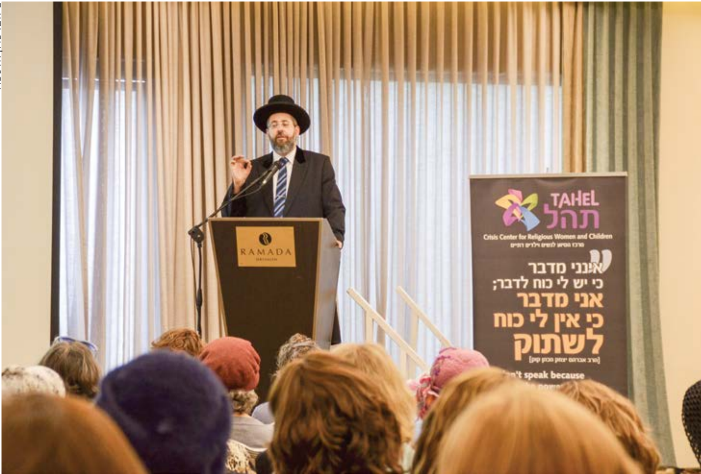
מה עושים במקרה של רווקה שנפגעה, של נשואה, של אשת כוהן. הרב הראשי לישראל דוד לאו בכנס תהל